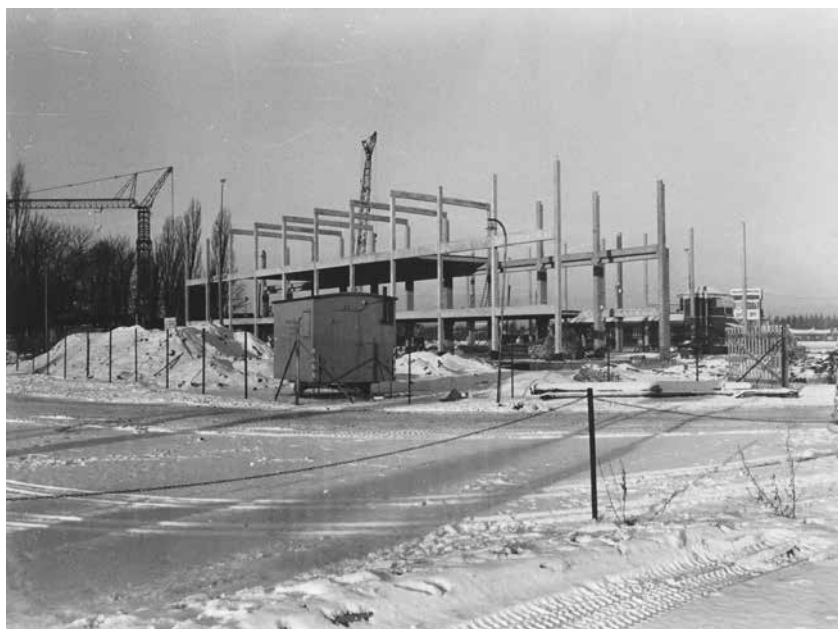
Amagerhallen på Løjtegårdsvej blev bygget et par år før Hollænderhallen. Fotograferet vinteren 1968-1969.