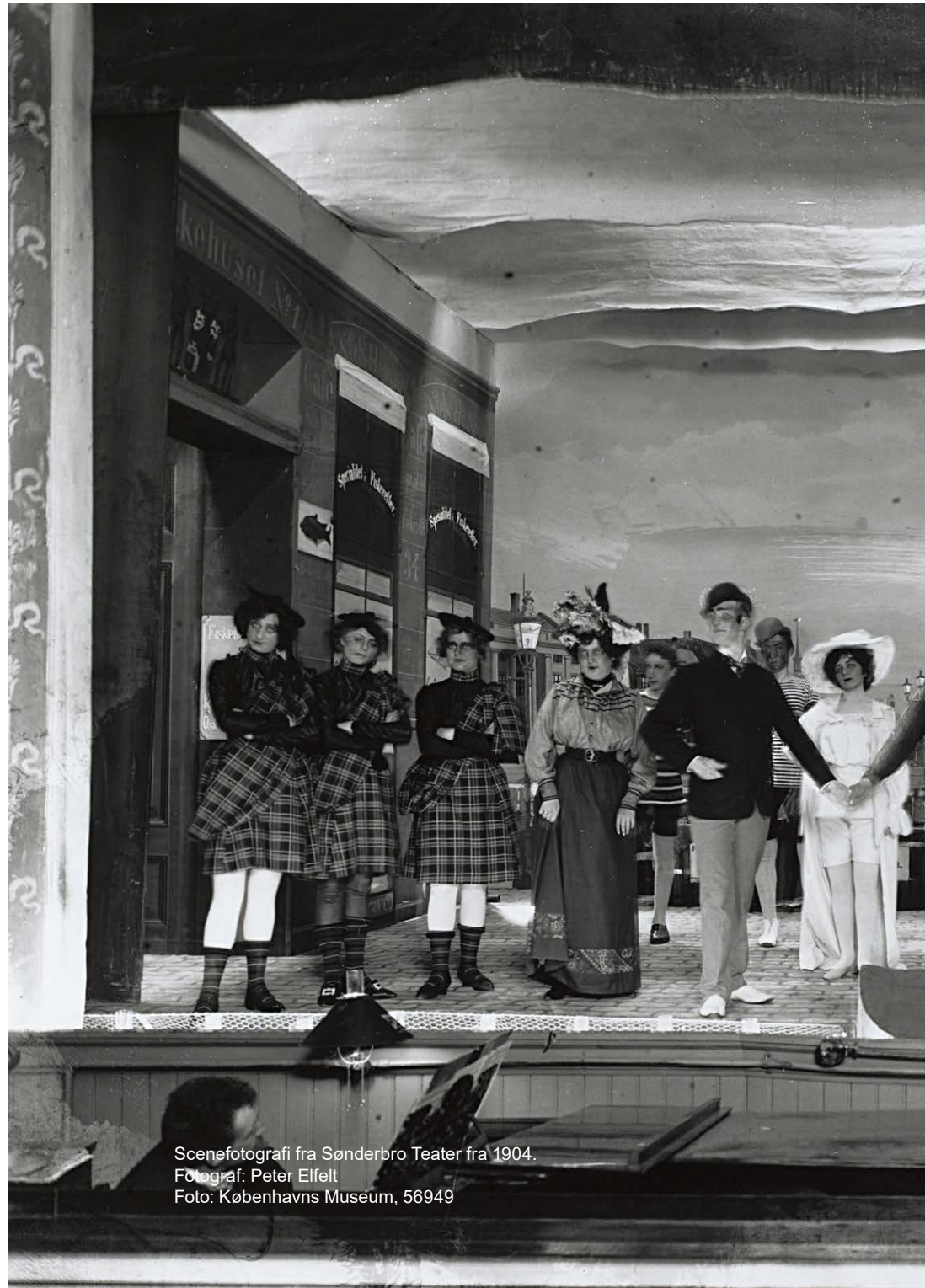
Scenefotografi fra Sønderbro Teater fra 1904. Fotograf: Peter Elfelt Foto: Københavns Museum, 56949