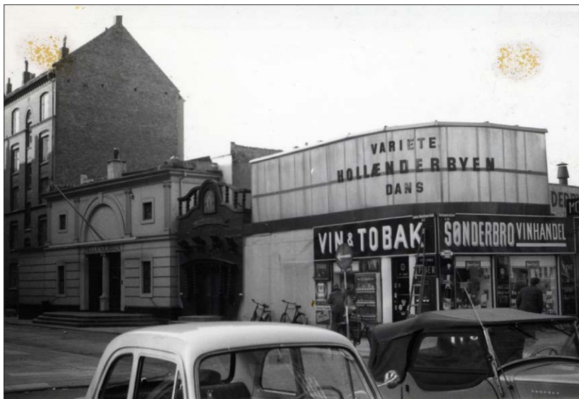
Varieté Hollænderbyen efter Sønderbro Teater var ophørt. Det varede ikke længe før end de lave bygninger måtte lade livet for nye boliger til den voksende befolkning på Sønderbro. Fotograferet omkring 1958-1960.

Børn blev sat op første gang på Sønderbro Teater inden 1906, så hun må have været hurtig til at lære at læse.