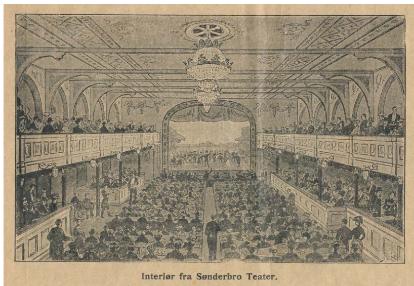
Interiør fra Sønderbro Teater.

Teatersalen set hen mod scenen, hvor logerne, balkonerne samt både første og anden parket var fyldt med publikum. Salens udsmykning og indretning fremgår tydeligt af tegningen.