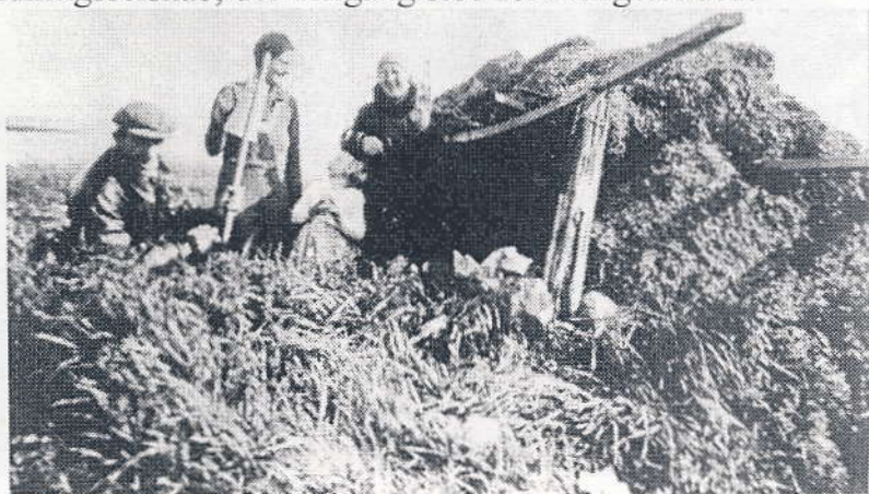
Kaffepause ved tanghytten ved Nordre Kløp, 1935.