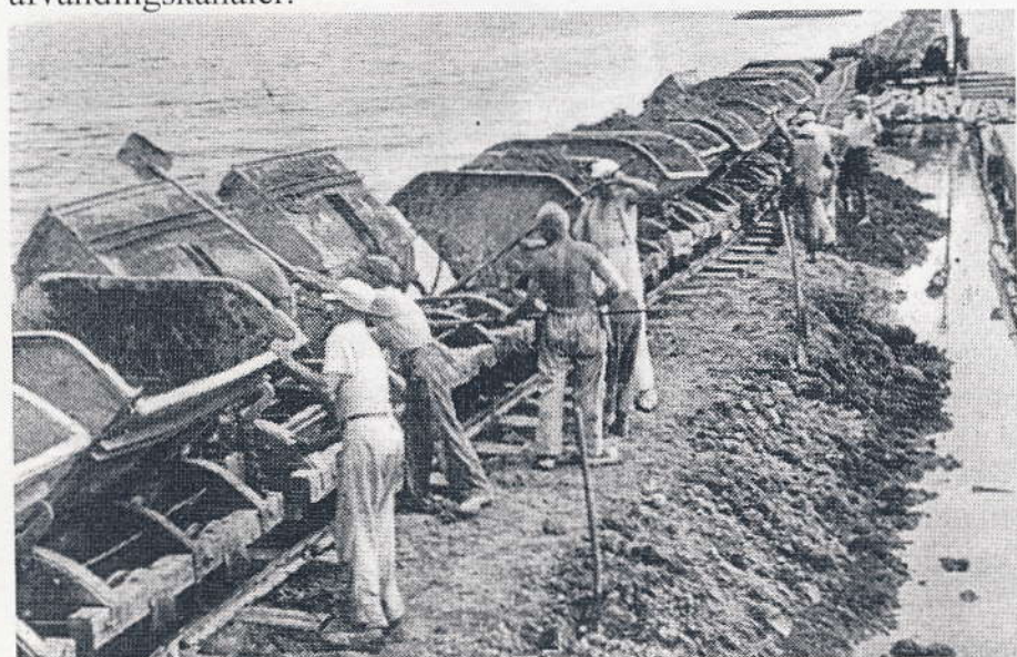
Inddæmningen er nu i fuld gang her i 1940

Arbejdet var meget mandskabskrævende, for selvom man rådede over kædegravningsmaskiner og tipvognslokomotiver, var der stadig meget der skulle udføres med skovl eller spade. Der skulle først anlægges et 13 km lang dæmning, der gik fra slusen ved Sjællandsbroen til Kongelunden. Jorden hertil fik man fra udgravningen af en sejlrende til Sydhavnen. Derefter skulle området indenfor diget afvandes ved hjælp af 2 pumpestationer og nogle afvandingskanaler.