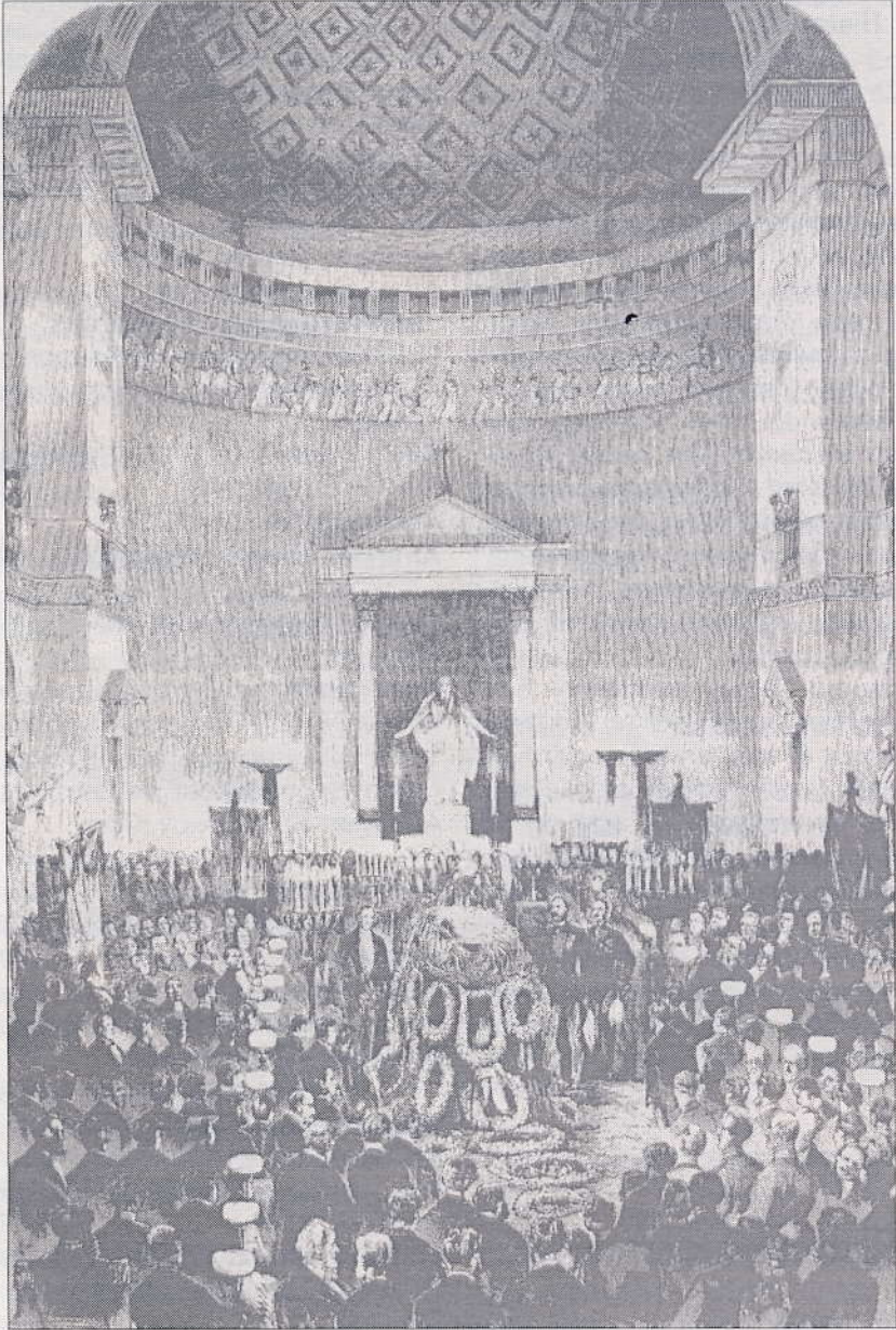
H. C. Andersens begravelse i Vor frue Kirke 1875. Tegning fra Illustreret Tidende samme år.