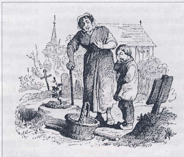
Tegning af Vilhelm Pedersen (1820-1859) til H.C. Andersens eventyr ”Hun duede ikke”.