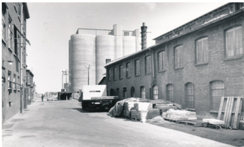
Kastrup Glasværk - til højre ses siloer og bygningen kaldet det lille magasin samt smedjens snoede skorsten. Til venstre ses marketenderiet. Fotograferet 1960.

I en alder af 63 år arbejdede Klas stadig i 65 graders varme med det hårde arbejde med at puste store flasker, det afslørede en artikel i B.T. fra den 23. juni 1954. Det arbejde havde han haft i 20 år.