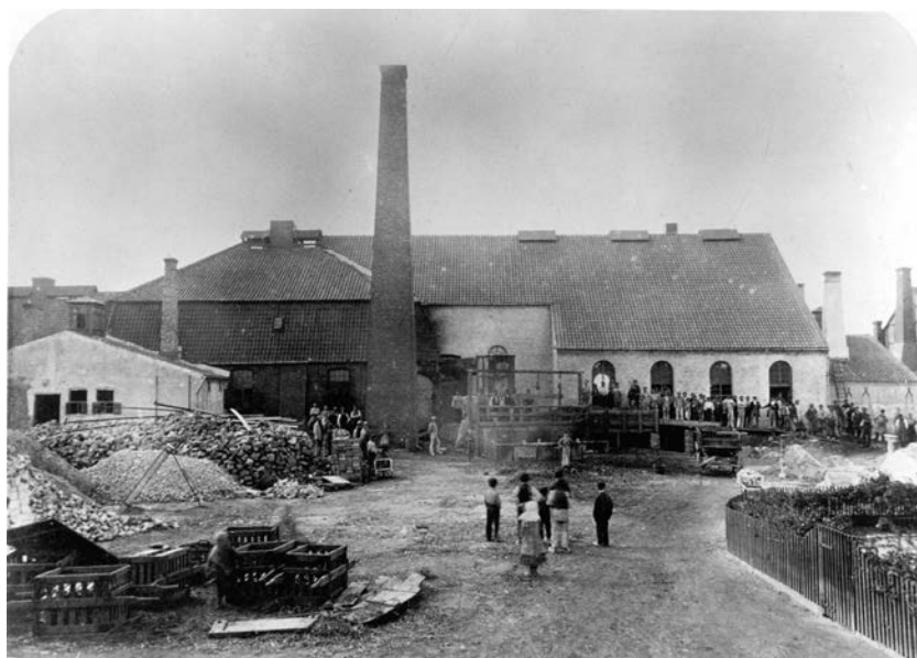
Hytte 1 og 5 med personalet stående uden for. Fotograferet 1879.

Protokollerne er ikke helt samstemmende. I en anden af