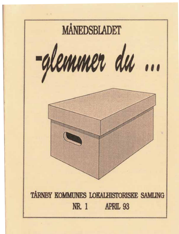
Det allerførste nummer af Glemmer Du

For at citere fra det første blad: ”Vi håber, at interesserede kommer med forslag til indlæg. Man er naturligvis også velkommen til selv at skrive til bladet om lokalhistoriske emner, som spænder lige fra beretninger fra barndommen, skoleliv, arbejdspladser i kommunen til nutidige oplevelser med lokal kolorit.” Et håb som redaktionen stadig deler.