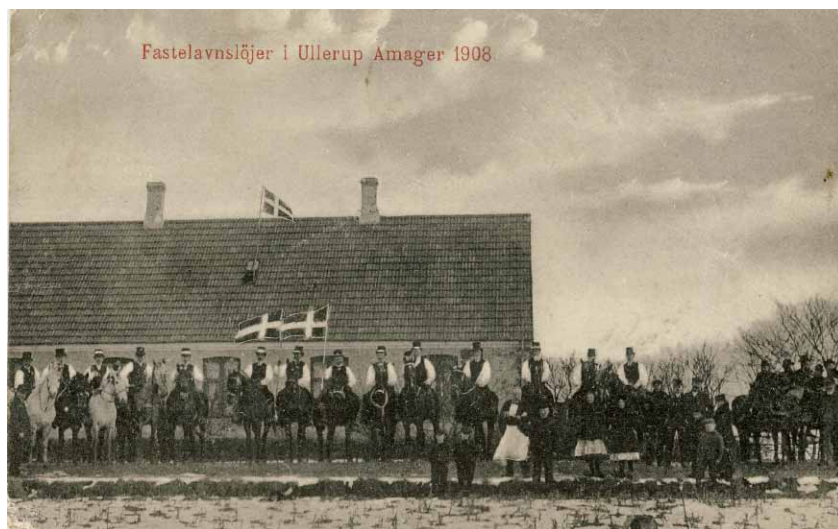
Fastelavn i Ullerup med ryttere, fanebærere og musikvogn.

Vi tager på besøg til fastelavn i Tømmerup, hvor vi blandt andet er inviteret til fastelavn på Fædres Gave i år 1967. Fastelavn med tøndeslagning til best har en lang historie og har sin oprindelse med de hollandske indvandrere, som kom til Amager helt tilbage til 1520'erne. Skikke har udviklet sig gennem tiden, nyt er kommet til og andet er forsvundet, men er i forskellig form bevaret på hele Amager.