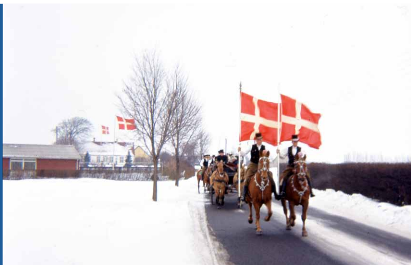
Dannebrog vajer. Fastelavnsryttere rider på Tømmerupvej ved Skelbo. Foto: Fastelavnsmandag 1962

Det må ikke være den samme pige mere end én gang. Der skal være styr på traditionen. Det koster en del at være rytter i fastelavnsoptoget. Først og fremmest er det dyrt at holde en hest, selvom hesten selvfølgelig kan lånes. Derudover skal der bekostes seletøj – også kaldet snogetøj eller snekketøj – fremstillet af en karetmager. Det er inspireret af Gardehusarregimentet, der til officererne fik seletøjet i 1789. Der er stor prestige i et flot seletøj, så rytterne prøvede især før i tiden på at overgå hinanden. Det består af omtrent 800 snekker eller konkylier og det