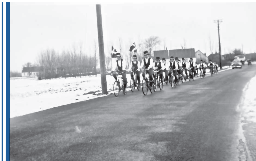
Fastelavnsoptog i Tømmerup på cykel. Drengene gennemfører en tro kopi af mændenes fastelavnsoptog med høj hat, hvid skjorte og broderet vest. Foto: Fastelavn i Tømmerup fra ca. 1958.

pagnerede skålene og sangene. Musikerne var professionelle og de spillede også op til bal ved andre lejligheder f.eks. på Strandhotellet eller Badehotellet i Dragør. Musikerne sad på vognen med ansigterne mod hinanden. Kusken, der kørte vognen, skulle være vant til at køre med heste og vogn. Det er ikke en helt let opgave. Særligt ikke når der skulle vendes rundt på en gårdsplads. Rækkefølgen af rytterne var efter alder på rytterne, så de ældste red først. Dog har der været lidt rotation i, hvem der var flagmænd. Farven på hestene