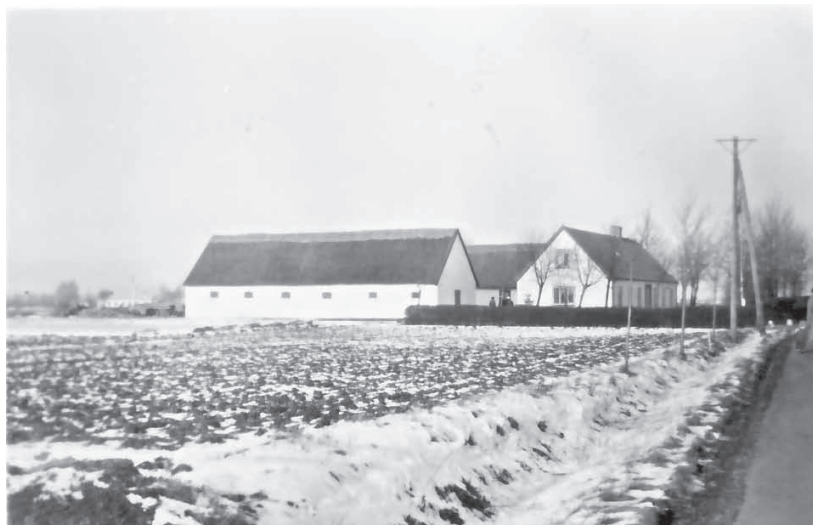
Fædres Gave i vinterklæder. Gården havde dengang to indkørsler, så det var lettere for musikvognen og fastelavnsrytterne at komme ind og ud med hele optøget. Foto: Vinteren 1953-54

skulle helst passe sammen, så det kunne også være en faktor i den endelige placering for en rytter. Der blev ligeledes skelet til hestenes gemyt, de skulle helst være rolige og vant til at ride i fastelavnsoptog. Og om nødvendigt skulle hesten næsten kende vejen selv, hvis rytteren ikke kunne på grund af punch-indtaget.