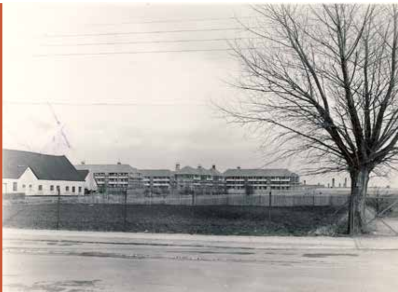
Tårnbyvej set mod syd og Allégårdens længer samt Blykobbevej.

I 1965 hævdede Amager Bladet, at der var et par tusinde boligsøgende og omkring 1.000 familier uden selvstændig lejlighed. På det tidspunkt ventede kommunen på tilladelse til at få Olufsgårdens II C anden afdeling i gang. Foruden sidste etape af byggeriet ved Krostræde og Ved Diget, der ville give 48 nye lejligheder. Også Tårnbyparkens sidste afsnit på 35 boliger ventede på grønt lys. Opførelsen af smedenes byggeri på Vestre Bygade af 160 lejligheder blev