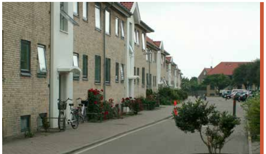
Olufsgården som det så ud sommeren 2013.