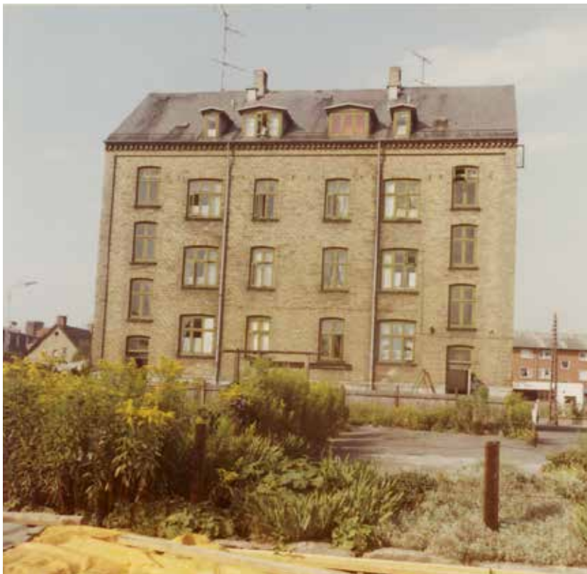
Nordmarksvej 81 set fra bagsiden af huset kaldet Tilfredshed .