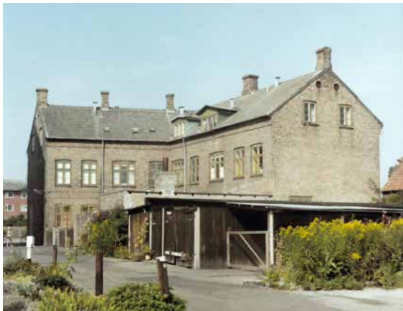
Lille Tilfredshed set fra gårdsiden omkring 1971.