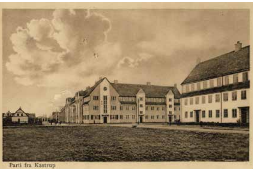
Søvangs Allé omkring 1920-1925.

Selve byggeriet mødte en del problemer, da der var flydesand i undergrunden. Det blev derfor nødvendigt at understøtte bygningen yderligere og afvande området. Dertil skulle der bruges penge på at få rent drikkevand, kloakering