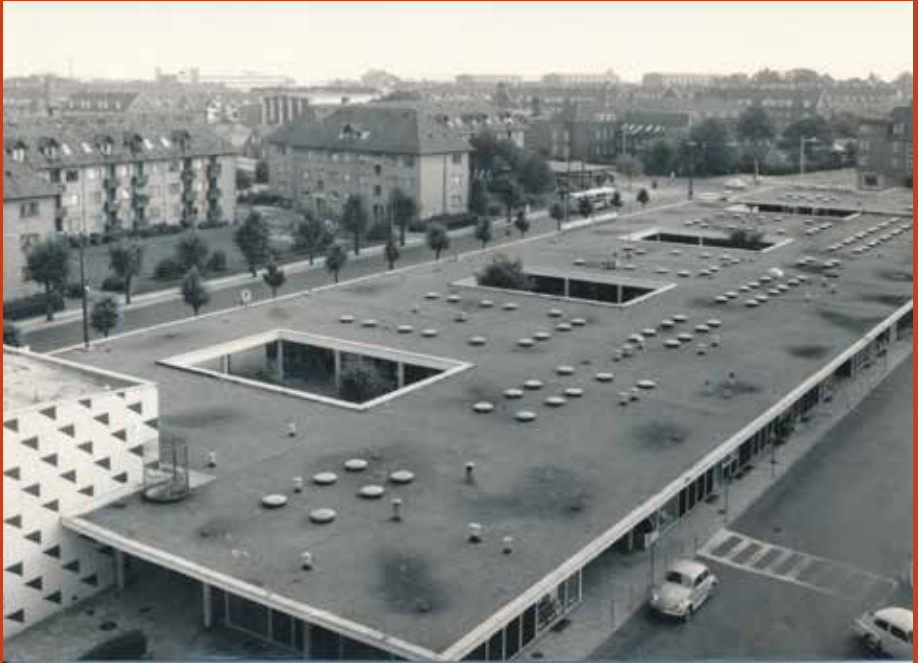
Skottegårdens butikcenter på Kastrupvej og Saltværksvej fotograferet i 1970. Foruden ses Lufthavnsparke i baggrunden. Fotograf: Foto-Lejbok A/S Foto: Tårnby Stads- og Lokalarkiv, B6944

Vil du være med til at skrive Tårnby historie? Du kan fortælle om dine oplevelser i en bebyggelse i Tårnby Kommune. Det kan både være din barndom eller dit voksenliv. Du kan også fortælle, hvad du ved om de billeder, der i dette Glemmer Du. Skriv til arkivet på bibliotek@taarnby.dk og fortæl din egen historie.