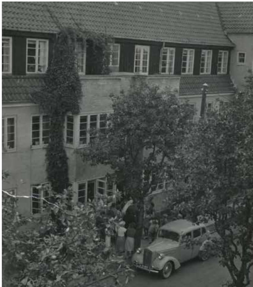
Søvang Allé – de kommunalt opførte boliger. Byggeriet blev påbegyndt i 1917. En hyggelig gade med træer og grønt. Fotograferet i 1950. B6850

I en regnskabsbog over huslejen og lejere fra 1921 til 1924 kan det ses at den billigste husleje var på 24 kr. om måneden. Det var for de mindste lejligheder i komplekset – Fannys Allé 11. Senere fik vejen navnet