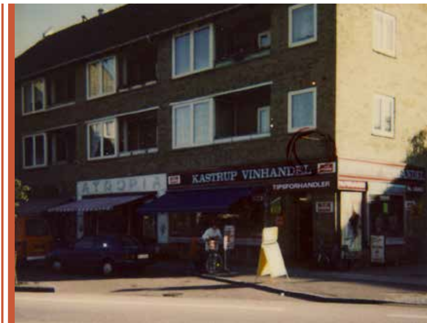
Postparkens forretninger ud til Kastrupvej. Fotograferet omkring 1975. Foto: Tårnby Stads- og Lokalarkiv, B3477

børnehave. Desuden var der også en række mindre forretninger ud til vejene.