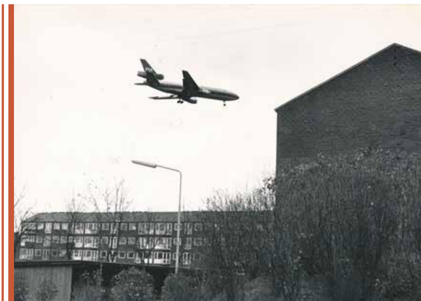
Fly over Allégården forlængede byggeprocessen. Her ses en DC10 fra Pakistan Airways ved indflyvning til lufthavnen. Fotograferet omkring 1985. Fotograf: KT-Posten Foto: Tårnby Stads- og Lokalarkiv, B6954

måtte svare på mange spørgsmål om boligmangel og det langsomme byggeri. Det var dog ikke i kommunens hænder, men drejede sig mere om uvisheden omkring lufthavnens placering og udvidelse. Ingen ønskede at opføre boliger, som fik for høje støjgenere af flytrafikken. Med afsnit VI blev de sidste lejligheder i Allégården bygget med indflytning fra 1972. Den gamle gård blev inddraget i bebyggelsen som selskabslokaler og