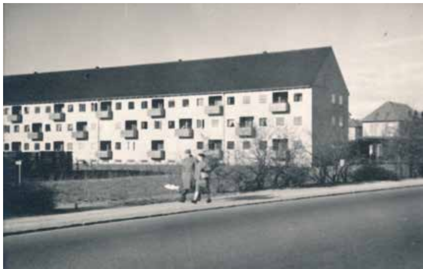
Skottegården lejlighedskompleks fotograferet i 1956.