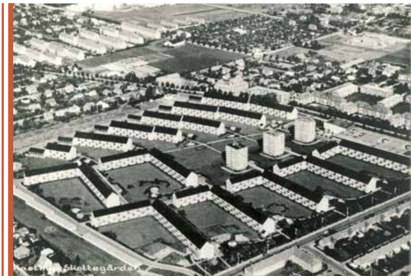
Luftfoto af Skottegården og omegnen. Er oprindeligt et postkort. Fotograferet i 1957.

Foto: Tårnby Stads- og Lokalarkiv, B4818