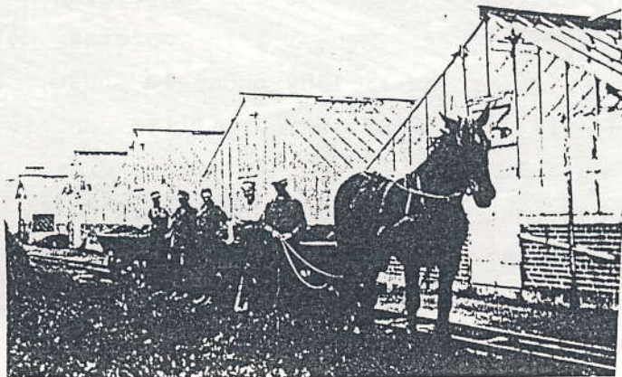
Personale fra Allegården. Ca. 1935.

På gården var i begyndelsen af 30'erne ansat 3 bestyrere, 1 salgschef, 20 medhjælpere, samt elever, arbejdsmænd og koner. Der holdes 15 heste, 2 automobiler og flere andre vogne og desuden har Allegården sit eget vandværk.