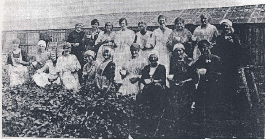
Jordbærplukkere ved Ny Kastrupgård ca. 1945