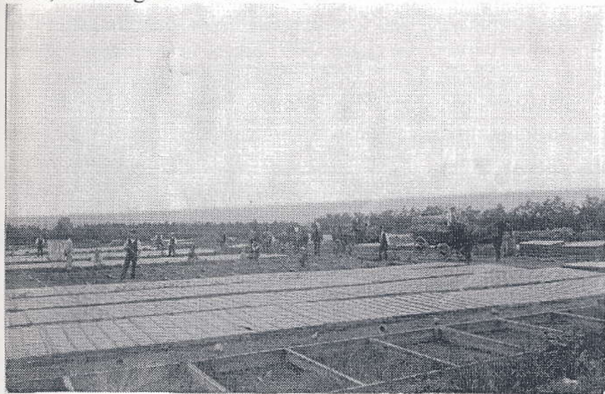
Mistbænkepladsen. Ca 1910