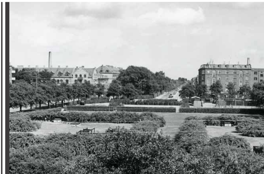
En del af Kastrupvej med Filipsparken i forgrunden. I midten af fotografiet ses Italiensvej med Sundby Hospital til venstre og ejendommen Schelenborg til højre.

på benene og stædig. Når jeg fik en på tuden, blev jeg gal og forsøgte at give igen. Jeg nåede kun at bokse tre kampe. Jeg tabte en og to endte uafgjort.”