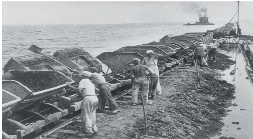
Inddæmningen på Vestamager er i gang. Ca. 1940