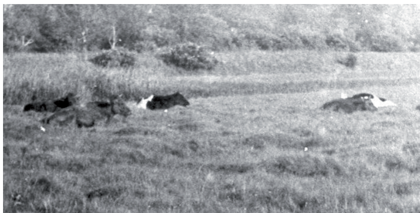
Køer på Vestamager i 1930. I baggrunden diget.

brugere gravede grøfter, så vandet kunne ledes bort, skete det, at markerne blev oversvømmet - vi taler om tiden før den store inddæmning. Min mor har fortalt, hvordan de engang måtte stage sig frem i en robåd til de marker, hvor de dyrkede asier, og høste dem fra båden. Vandet blev ledt ud i en kanal, og en vindmølle sørgede for at få det pumpet ud i Kalveboderne.