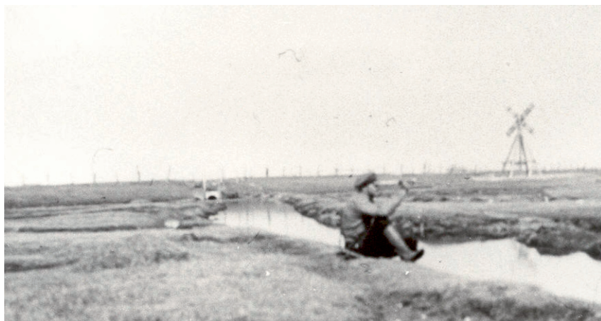
Vestamager med grøft og mølle i baggrunden.