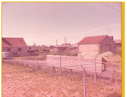
Pumpestationen, Bakel Allé 23.

I zone 4 var et dige fra Ullerup nordre vandløb til Kongelunden med en samlet længde på 1100 meter, gennemløbsgrøfter og vejoverførsler, men intet pumpeanlæg.