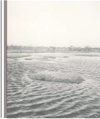
Oversvømmelse i lergravene i Tømmerup.