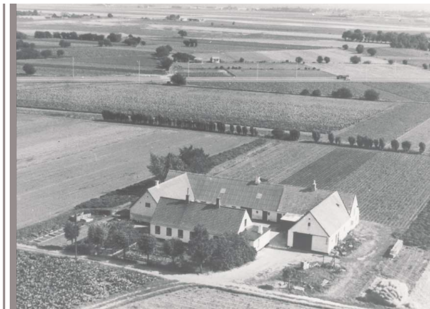
Luftfoto af Bakkelgården. Ca. 1950

sådan en væksel. Da han fik forklaret forskellen på en check og en væksel, svarede han kort, at det kunne han ikke tage sig af. På flere af byens gårde var grise-stalden og hestestalden ikke adskilt. Således også hos Ahrensberg. En nat rev en hest sig løs og kom hen til grise-stien, hvor den bed ryggen over på en af de små grise. Hesten, der i øvrigt ikke var nogen skønhedsåbenbaring - meget kantet og langhalset - hed derefter kort og godt "menneskeæderen".