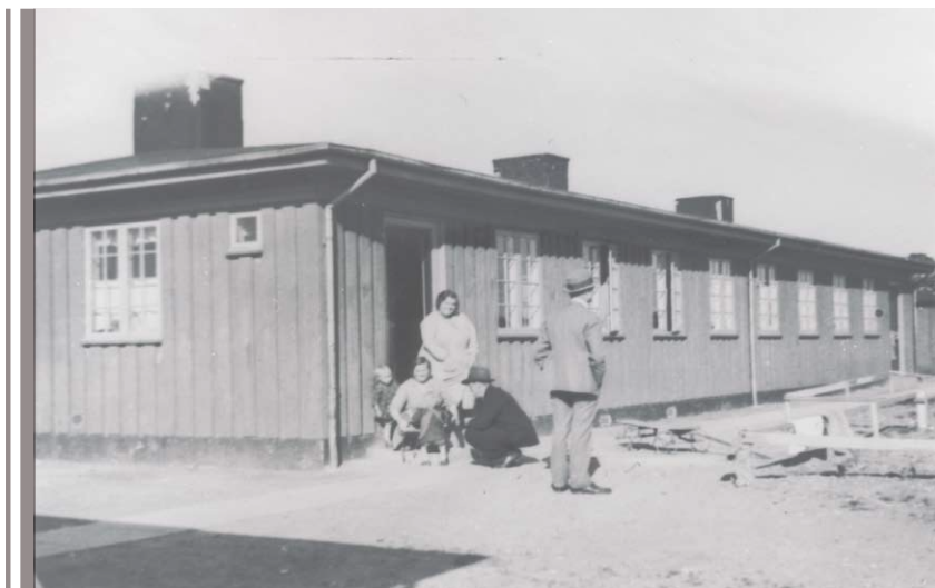
Husvildebarakkerne i Tømmerup. Ca. 1935

Til jul var det til butikken hørende vindue pyntet i bedste juleudstillingsstil med små huse med lys i, en kælkebakke og et lille tog, der kørte rundt.