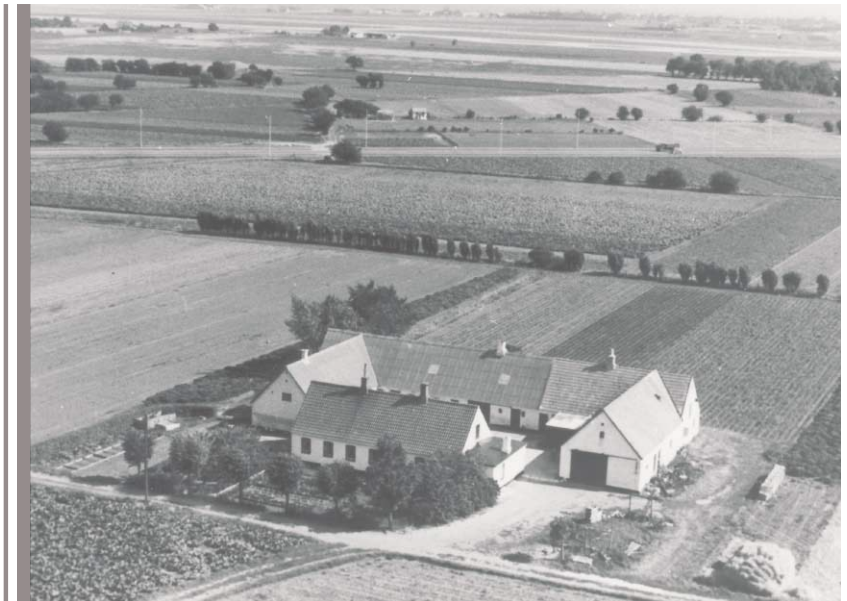
Luftfoto af Bakkegården. Ca. 1950