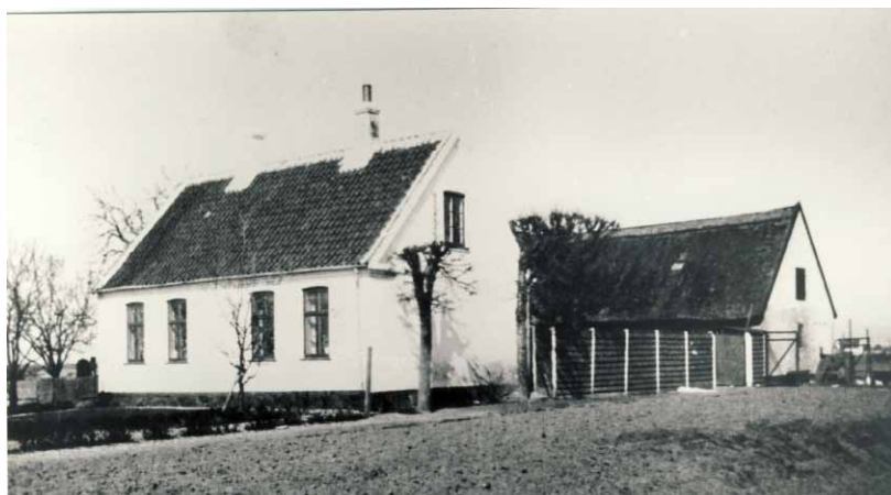
Isakgården, Tømmerupvej 60 Ca. 1940

De kan begge downloades på arkivets hjemmeside.