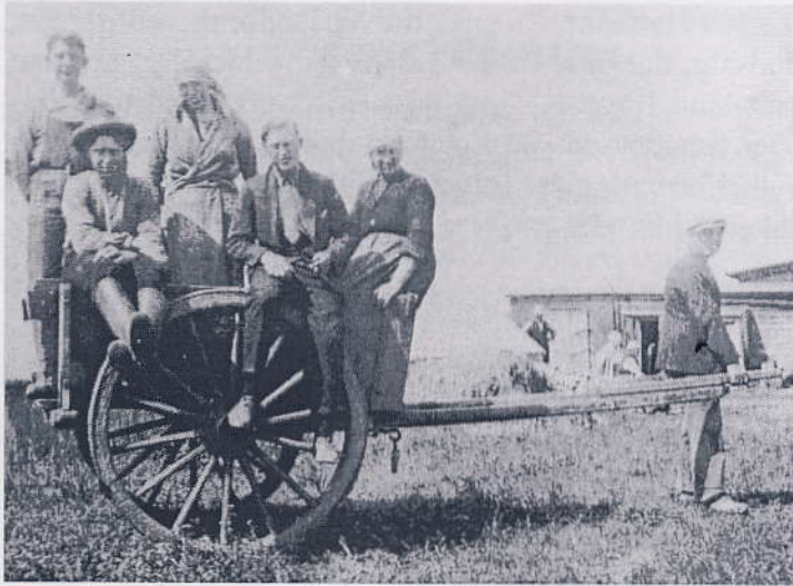
Ansatte fra Dalsgård på Tårnbyvej.