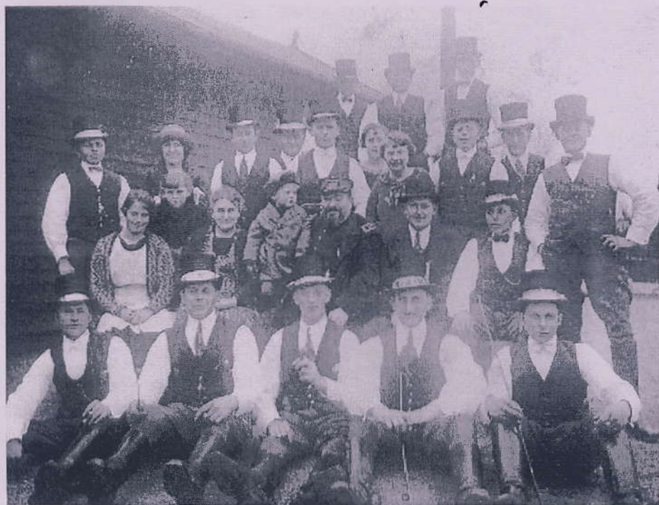
På fotografiet ses fastelavnsryttere fra Maglebylille foran Tømmerup Station 1924.

Fastelavnen nærmer sig med hastige skridt. Den traditionelle tøndeslagning med fastelavnsrytterne i Ullerup finder sted onsdag den 9. februar kl. 16 ved Fægårdsvej på skydebanerne. Hvis man vil med fra morgenstunden rider de 17 flotte ryttere ud fra Ejnar Lindgreen på Tømmerupvej kl. 10.