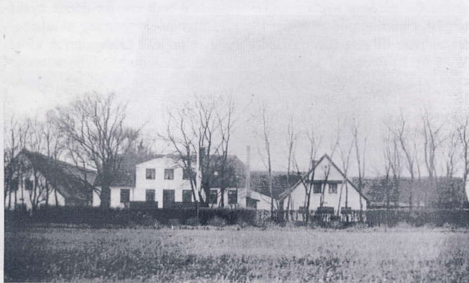
Petersdal i Maglebylille.

Der var rundt om i landet i begyndelsen af 1880'erne blevet rejst adskillige statuer af Frederik den VII, og på Amager ønskede mange borgere et lignende minde om den folkekære konge.