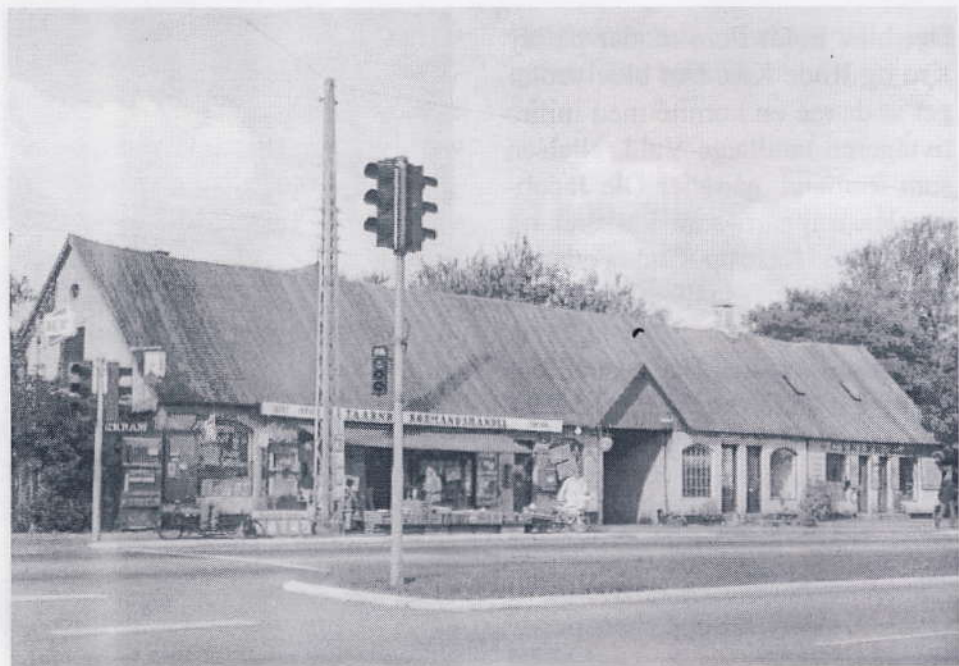
Gammalgård som udviklede sig til Tårnby Købmandshandel. Gården blev revet ned 1973.

ende ved Amager Landevej. Her blev der ved grundlovsfesten i 1949 nedlagt måske den sidste krans til ære for grundloven og dens giver Frederik den VII. Da det nye rådhus blev bygget i 1960, blev busten, da den var i dårlig stand, forvist til kommunens depot på Nordmarksvej. Her blev den flammernes bytte da depotet nedbrændte i 1970'erne.