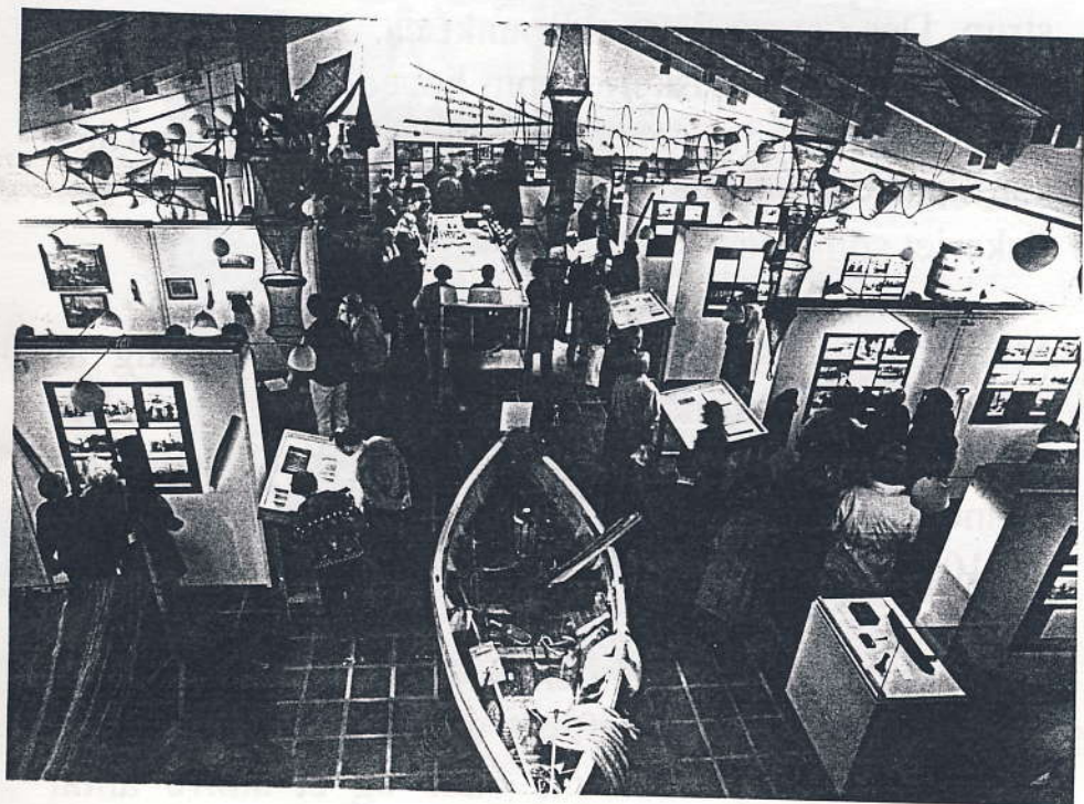
Her ses et vue over udstillingen i stakladen i 1990.