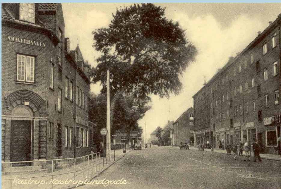
Postkort fra Kastruplundgade med Amagerbanken til venstre ca. 1950