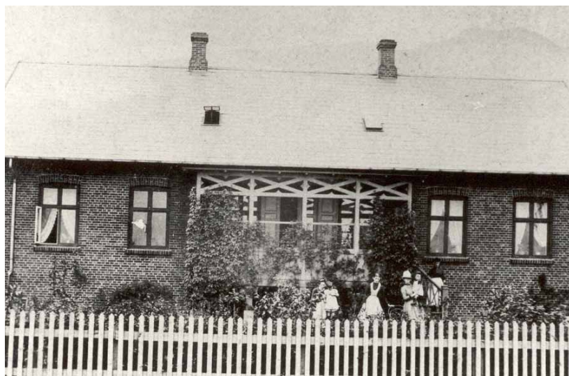
Villa "Strandhøj" på Amager Strandvej. Her var bank fra 1903 til 1929. Foto: ca. 1892.