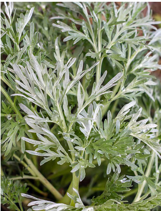
Foto: Malurt kan bl.a. bruges til snaps.