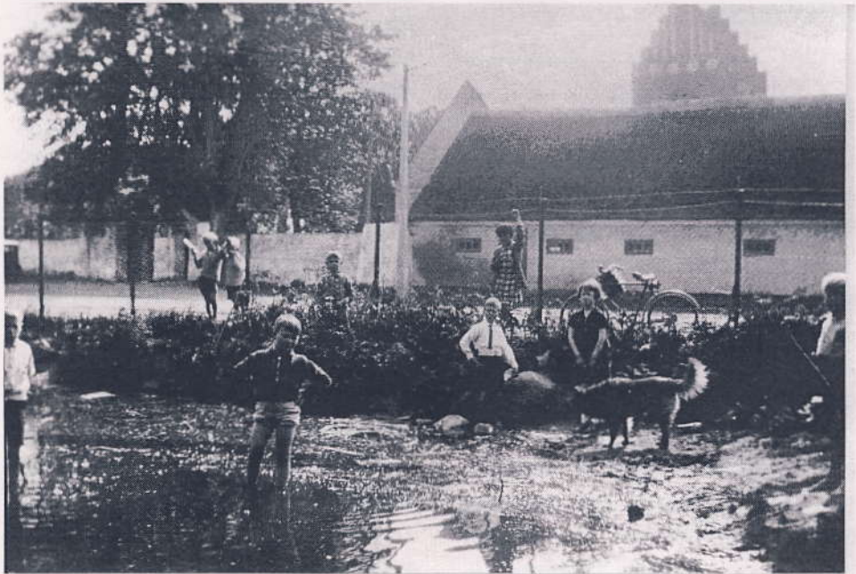
"Præstekæret" i Tårnby overfor kirken var legeplads for byens børn. Foto 1931.

I den fjernere udkant af billedet stod fars arbejdsløshed, men jeg tror ikke, at jeg gjorde mig rigtig klart, hvad dette begreb betød. Hver dag måtte han cykle ind til fagforeningens kontor på Frederiksberg for at få stemplet i bogen,