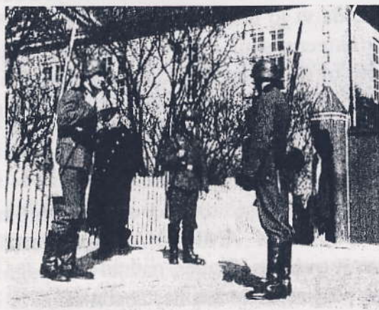
Tyskerne etablerede straks vagtposter uden for Generalkommandantboligen i Kastellet, 9. april 1940.

I 1940 var jeg 27 år og havde skiftende arbejdspladser, der mere eller mindre arbejdede for tyskerne, bl.a. B & W på Amager.