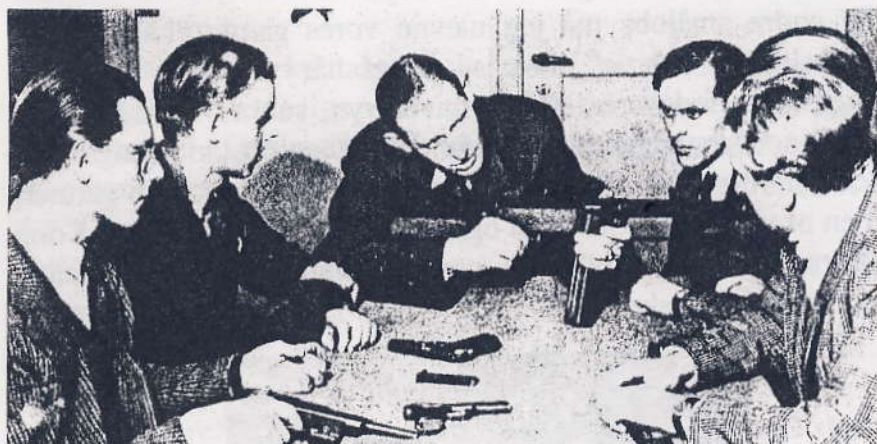
Der instrueres i brugen af våben (gruppen ukendt).

gaden, at det siger klik-klak - klik-klak," så det måtte vi holde op med, men vi havde nu også fået den nødvendige viden.