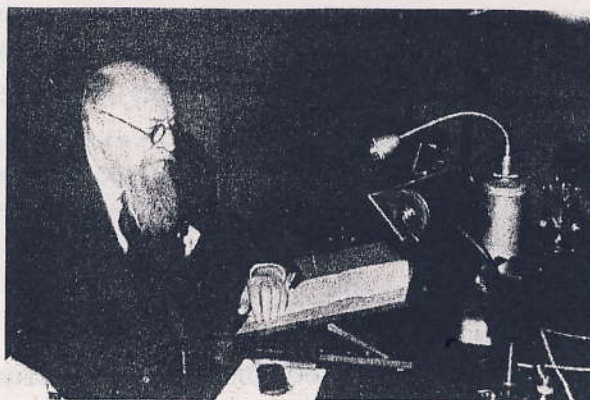
Statsminister Stauning taler til folket. Dette foto er dog fra hans opsigtsvækkende nytårstale, 1. januar 1940.

Jeg tog mit fotografiapparat og cyklede til Langelinie og fotograferede landsætningen af de tyske tropper med deres køretøjer og motorcykler og andet grej. Derfra videre til Nyboder Skole, der blev brugt til indkvartering af tyske soldater. Der var mange mennesker ved skolen, som fulgte sceneriet, også dansk politi. Men jeg så alligevel mit snit til at tag et par billeder, hvortil en mand pludselig sagde højt: ”Ved de ikke, at det er forbudt at fotograferer!”