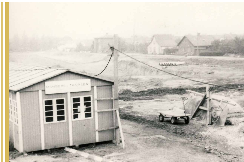
Lufthavnsmotorvejen anlægges ved Amager Landevej. Foto: ca 1960