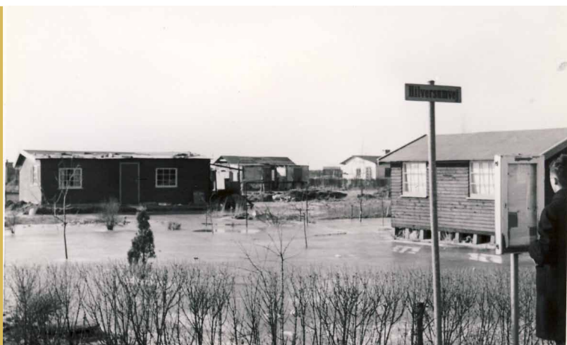
Et oversvømmet trist Vestamager ved Hilversumvej. Vinteren 1959-1960

revision af zoneinddelingerne. Zoneforslaget for Tårnby Kommune sigtede bl.a. imod en endelig løsning af de sociale og sanitære problemer på Vestamager. Den udstykkede og bebyggede del af det tidligere yderzoneområde nord for Nøragersmindevej og Liesel Alle blev overført til inderzone. Herved kunne parceljerne kloakeres og anvendes til helårsbeboelse. Denne zoneinddeling gjaldt dog kun for en 5 års periode, da det endnu ikke var afklaret, om en kommende hovedlufthavn skulle placeres på Sydamager eller på Saltholm. I 1969 blev en luft-