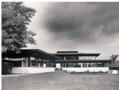
Nordregårdsskolen set fra Tejn Allé.

En tidligere fabriksbygning på Englandsvej 392 blev indviet i 1963 som en filialscole, idet Tårnby Skole og Løjtegårdsskolen afgav elever fra 8. og 9. klasse. Eleverne skulle undervises i metal- og træsløjd, samt teknisk tegning og bygge- og anlægsgang. Det var en ny undervisningsform, der havde