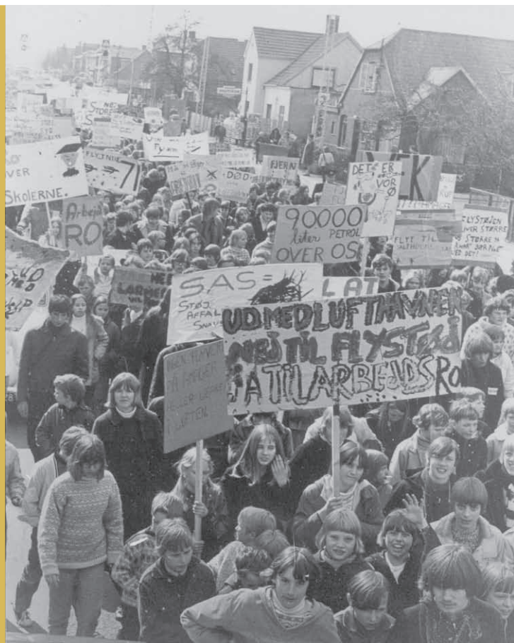
En af de mange demonstrationer mod lufthavnens flystøj går ned ad Saltværksvej. Her er det 200 skolelever, der var vrede over, at larmen fra flyene forstyrrede undervisningen.

om, da ejendomspriserne var steget voldsomt gennem de to årtier, men det blev afvist af staten. Maglebylilles dage var forbi.