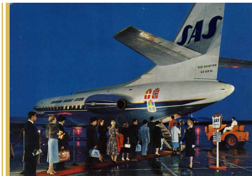
SAS.Caravelle Jet. Reklamepostkort fra 1970.