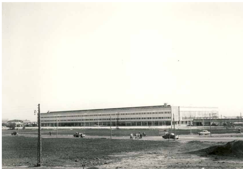
I april 1960 blev en ny lufthavnsbygning indviet, tegnet af Vilhelm Lauritzen A/S. Foto: ca. 1960

Saltholm. Alle de mange kræfter, der i disse år anvendtes på lufthavnssagen, førte frem til den principbeslutning, der i 1973 vedtog dette synspunkt. Desværre gik det jo som bekendt sådan, at ”den grønne front”, d.v.s. folketingsmedlemmer valgt vest for Valby bakke, ved den endelige beslutning væltede den vedtagne principbeslutning, så lufthavnen forblev i Kastrup.”