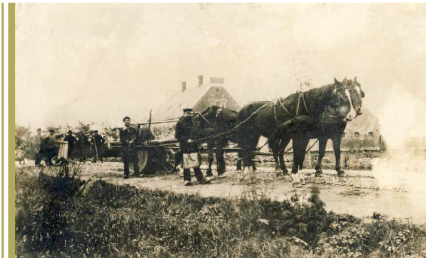
Vejarbejde udfør Helgeshøj Tømmerupvej 3, sandsynligvis benyttede man skærver og småsten som nævnt i teksten til at reparerer vejen med. Postkort fra ca. 1915

vel vedligeholdt. Der var i loven hjemmel til, at sognerådet efter en indgivet klage kunne pålægge de uefterrettelige at efterkomme deres vedligeholdelsespligt og, hvis dette ikke skete, selv udføre vedligeholdelsesarbejdet for de pågældendes regning. Men det skete ikke i praksis, for ingen ønskede at klage over en kollega.