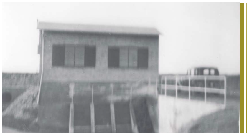
Pumpestation på Vestamager. Ca. 1935

få de nødvendige mærkepæle, og det var mange. Pælene blev tilspidsede og forsynet med et nummer med blå skrift. Så gik det af sted ud i fælled, hvor karlen og jeg under landinspektørens kommandoer og fagter fik banket de mange pæle i jorden efter et sindrigt system.