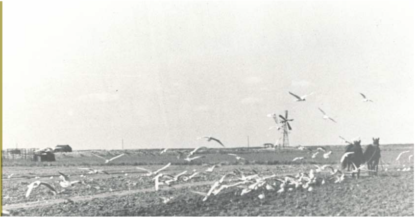
Ole Olsen, Tømmeruphøj, pløjer på sine marker ved Ugandavej. I baggrunden ses pumpe-og digelaugets vindmølle. Ca. 1950

I forbindelse med gravningen af hovedgrøfterne blev den udgravede jord lagt på de tilgrænsende lodsejeres jord, og det påhvilede herefter dem at udjævne den opgravede jord. Men det var et besværligt arbejde, for den opgravede jord var mestendels ler, der var meget tung at arbejde med.