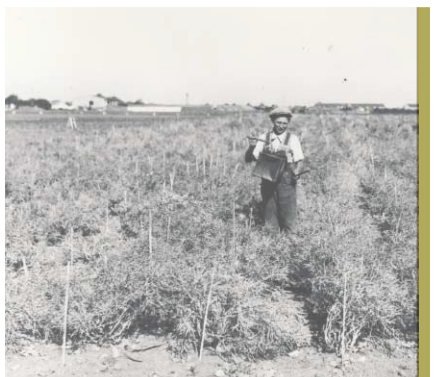
En ung mand er her i gang med at jage fuglene væk fra blomkålsfrømarken på Ny Kastrupgård ved at tromme.