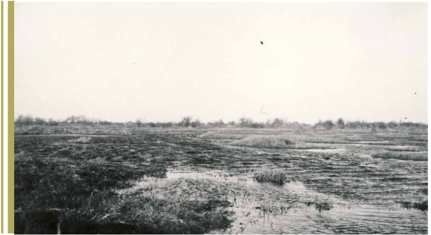
Oversvømmelse i lergravene i Tømmerup, 1943

blev afbrændt en gang om året, Kun de ejendomme, der tilhørte Tømmerup ejerlaug, måtte benytte lossepladsen.