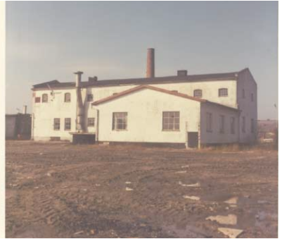
Fiskemels- og oliefabrikken på Oliefabriksvej kort før den forsvandt ved en brandøvelse

alle disse smågrøfter kunne jævnes sammen med den opgravede vold fra hovedgrøften. Der fremkom herefter et dejligt sammenhængende jordstykke.