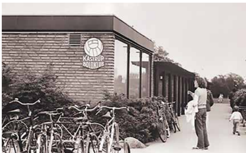
Kastrup Idrætsanlæg Ved Diget dengang hvor Kastrup Boldklub holdt til i klubhuset. Omkring 1985 flyttede klubben til Røllikevej.

I voksenalderen kom det ganske enkelt til at høre til et af Kong Flips helt store glansnumre, når han nogle gange yndede at vise sine flotte fordums bordtennisevner frem for omverdenen.