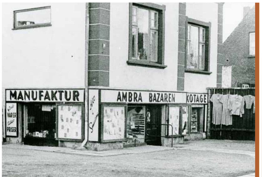
Manufakturhandel Robert Niensens forretning på Ambra Allé 36. Butikken lå der fra 1943 til december 1979.

blev bortledt til en faskine, som vi naturligvis også selv udgravede i hånden.