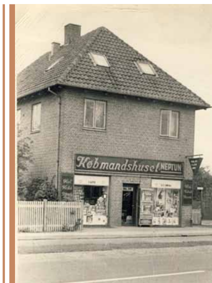
Her ses en af de nærliggende købmænd på Amager Landevej 164. Butiksvinduerne er fotograferet i 1939.