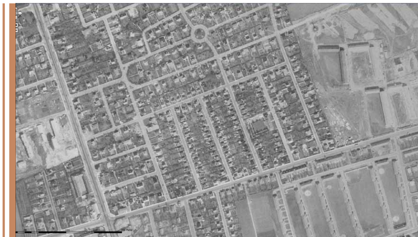
Luftfoto fra 1954. Villakvarteret omkring Klitrose Allé ses her næsten udbygget. Til venstre anes Tårnbyparken og til højre er Skottegården ved at blive bygget.

koks, der ikke var forbrændt endnu. Som tidligere nævnt benyttede min far sig af det i tiden omkring besættelsen fra 1940-1945. Hele stykket blev gennemgravet. Der blev skovlet op i en sigte, alle koksene blev sorteret fra og taget med hjem. Da jeg var blevet lidt større, kørte jeg altid med min far derhen. Jeg havde fået min egen cykel, så jeg kunne køre pænt ved siden af. Det har som oftest været lørdag eftermiddag, når min far havde fri fra arbejde. Redskaberne blev bundet til stangen på cyklen. En termokande med kaffe var med, og hos bageren i Postparken blev der købt wienerbrød.