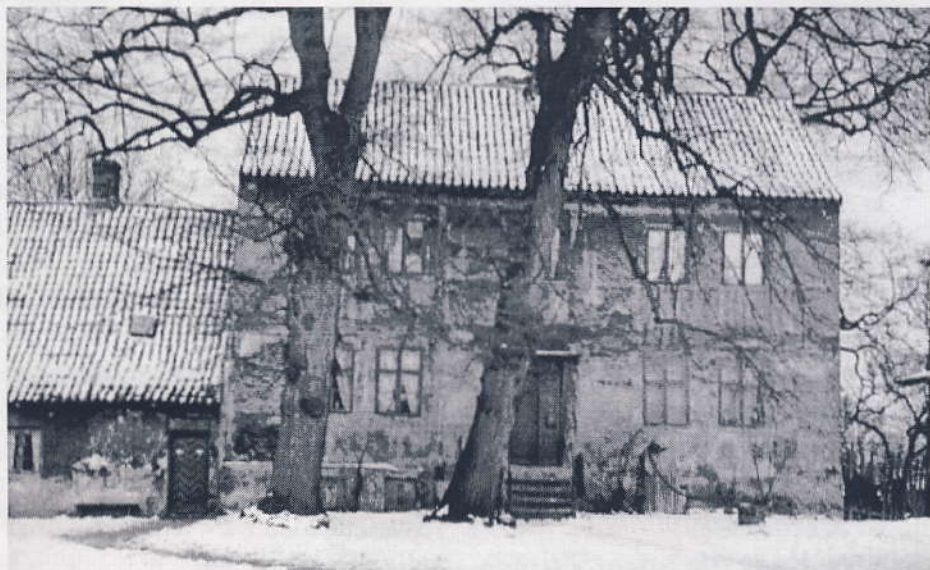
Svanelejegaard, også kaldt Dyvekes Gaard og sidst kaldt Rødegård inden nedrivning i 1942-43.

Denne Ø er gjort til en meget frugtbar Ø ved hjælp af disse Indbyggers store Arbejdsomhed og Industrie. Der findes ikke en udyrket Plet Jord undtaget det, som ligger til Fælles, hvoraf noget indtages næsten hvert aar af Øvrigheden.