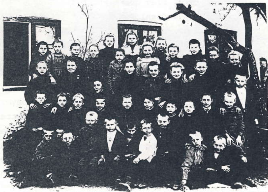
Klassebillede fra Pogeskolen 1899.