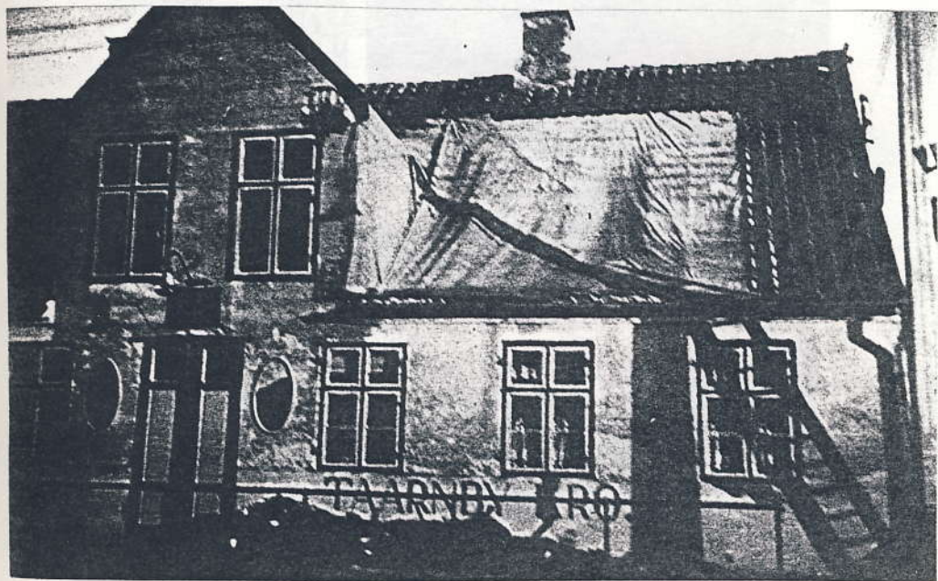
Tårnby Kro efter en brand i 1950.