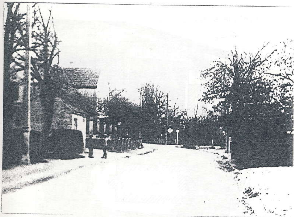
Omkring 1930 lignede Engelsvej en fredelig landsbyvej. Kroen og pumpehuset ses til venstre.