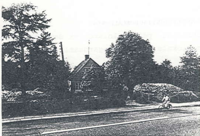
Pogeskolen mellem nedrevne huse.

På Englandsvej 322 ligger et hus, som kendes under betegnelsen Pogeskolen. Huset skal eksproprieres i forbindelse med anlæggelsen af Øresundsforbindelsens landanlæg, men er endnu ikke nedrevet. Lokale beboere har taget initiativ til en ny forening, hvis formål er at redde Pogeskolen. Bevaringsforeningen Tårnby Pogeskoles Venner forestiller sig skolen flyttet til en tom grund bag Tårnby Kirke, som ejes af Tårnby kommune (Fru Olsens hus).